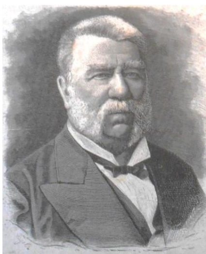
Рис. 1. Петр Григорьевич Редкин (1881 г.)

В общем, разносторонность занятий молодого Редкина в стенах Нежинской гимназии благотворно сказалась на развитии его энциклопедического ума и общей начитанности. В частности, в гимназии имелась довольно большая библиотека, в особенности книги по истории на английском и французском языках. Будучи принятым в помощники местного библиотекаря (в том числе благодаря хорошему знанию французского языка), П. Редкин (Рис. 1) имел свободный доступ ко всем фондам и, более того, даже предпринял (вместе с другими участниками кружка) попытку краткого изложения многотомной Всеобщей истории, изданной английским научным сообществом. Все это и многое другое способствовало становлению П.Г. Редкина как ученого-энциклопедиста, педагога, общественного деятеля.